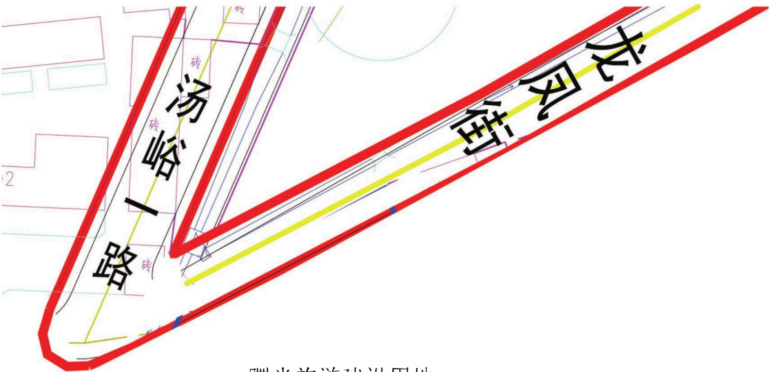
曙光旅游建设用地